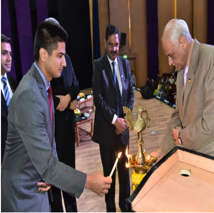
Lightning of lamp by dignitaries during inauguration ceremony at National Conference