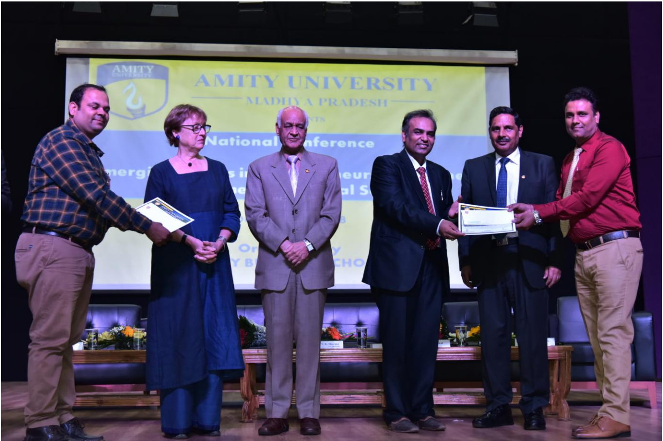
The Best research paper award being conferred by the dignitaries to the participants in National Conference